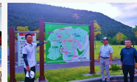
【パークゴルフ大会】 スポーツの秋！パークゴルフの秋！栗駒の自然の中で秋を堪能しました。