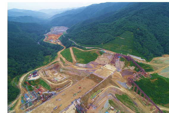
右岸（施工状況） 2023年9月撮影