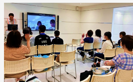
【女子中高生と鹿島職員 交流会の様子】 女性職員2人の学生時代のことから、現在のお仕事内容までスライドを使いながら詳しく教えていただきました。

8月1日、秋田大学主催で県内の女子中高生へ向けたダム見学会が開催され、KAJIMA DX LABOの見学に加え、福島県の鬼太郎山風力発電所建設工事で働く鹿島の女性技術職員とのオンライン交流会が行われました。「館内でのAR体験、交流会を通して、楽しく学ぶことができ、進路選択のためになる1日になった。」と好評をいただきました。 9月24日、東成瀬村壮実スポーツ大会が開催され、当JVからも数名がパークゴルフに参加しました。当日は天気にも恵まれ、チームを組んだ村内の参加者の皆さんと会話を弾ませながら、スポーツの秋を堪能しました。 成瀬ダムは夜間も着々と工事が進んでいます。秋の夜長のおともに、成瀬ダムの夜景写真をお届けいたします。