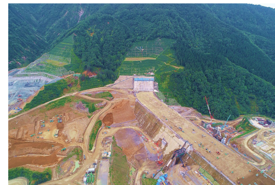
左岸（施工状況） 2023年9月撮影