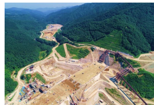
左岸（施工状況） 2023年7月撮影