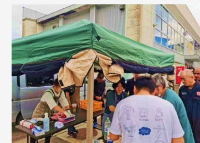
【苺スイーツの屋台の様子】 甘酸っぱいいちごミルクは暑さも吹き飛ばすと大人気でした！