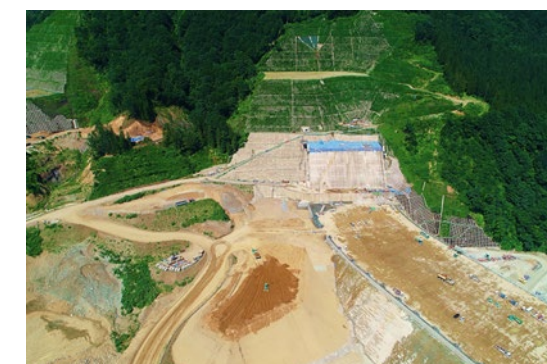
右岸（施工状況） 2023年7月撮影