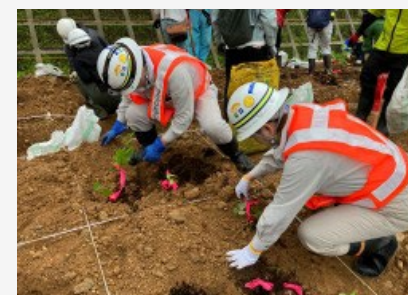
【森づくりでの植樹の様子】 木々の里親として、幼木がすくすく育つようお願いを込めて植樹しました。

7月8日、ジュネス栗駒スキー場の駐車場をお借りして、焼肉大会を開催しました。お山の大将さん発案の苺スイーツや仙人イワナ、ホテルプランのピザなど県内のグルメもグルメも勢ぞろい！地元の皆さんに、お寿司、お肉、飲み物をご用意いただき、美味しく、にぎやかに日々の疲れを癒しました。