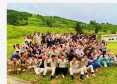
【焼肉大会集合写真】 最後はダム式万歳でスマイル！