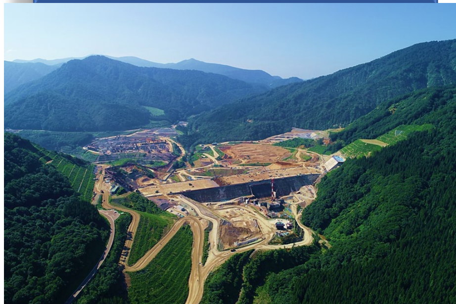
ダムサイト全景（下流より）2023年7月撮影