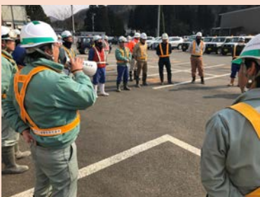
朝礼後の打合せ (拡声器使用)