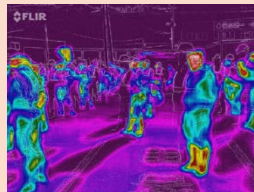
サーモグラフィカメラの状況