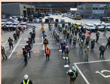
朝礼時の離隔状況