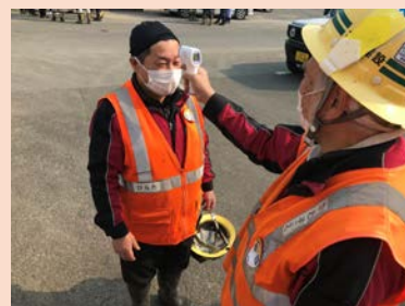
非接触体温計での計測の様子